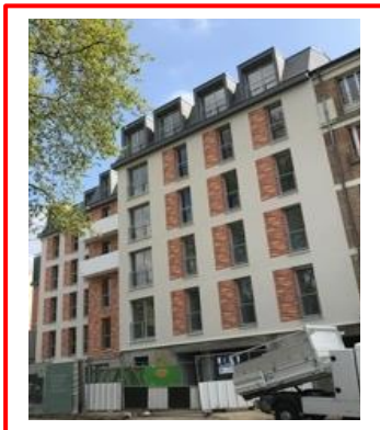
Immeuble sur l'ancienne station-service R+4+C

La comparaison entre une solution massive et une solution élégante est parlante