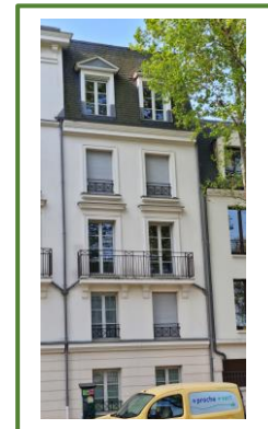
Immeuble situé au 47bis bd Carnot R+3+C

MERCI DE SOUTENIR L'ACTION MENEÉE POUR :